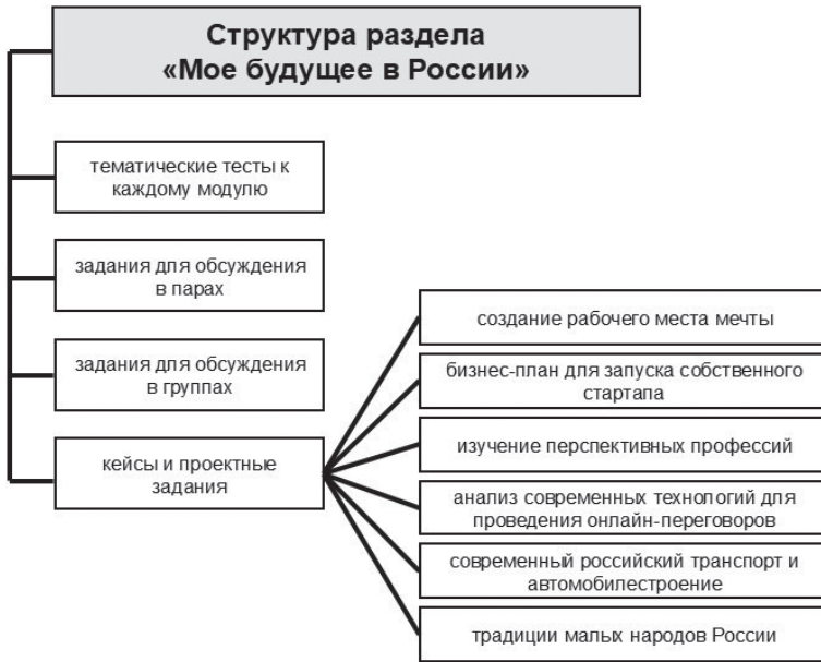
Рис. 4. Разделы УМК «English. Английский язык» [24]