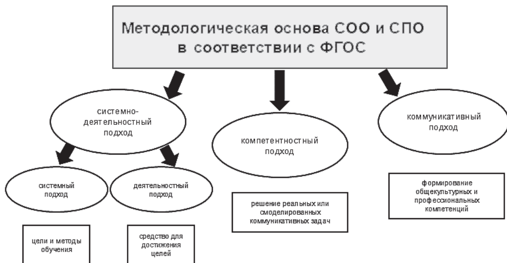
Рис. 1. Методологическая основа СОО и СПО в соответствии с ФГОС

Совокупность вышеуказанных подходов позволяет создать комфортную среду для обучения, способствует формированию устойчивого познавательного интереса и позитивной мотивации к активному изучению языка.