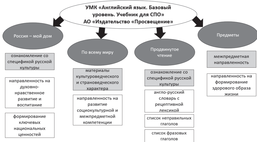
Рис. 3. Структура раздела «Мое будущее в России» (My future is in Russia)