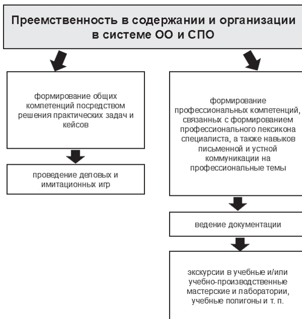
Рис. 2. Преемственность в содержании и организации в системе ОО и СПО

Отметим, что указанные на рисунке 2 экскурсии в рамках преемственности на данных