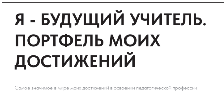
Рис. 1. Типовой заголовок персональной страницы студента для размещения материалов портфеля достижений