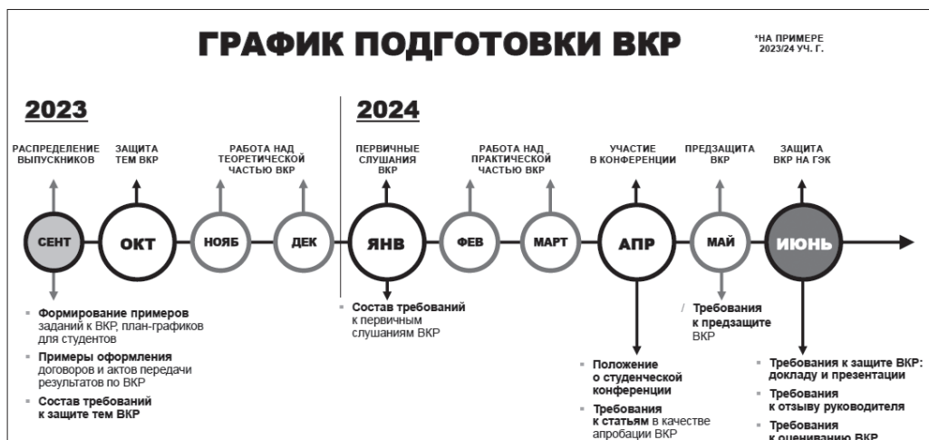
Рис. 1. Пример дорожной карты процесса подготовки ВКР в 2023/24 учебном году

Работа над подготовкой ВКР в техникуме осуществляется системно в течение всего выпускного учебного года (рис. 1).